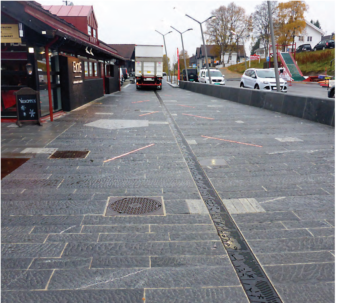
Det handler om å være forberedt! Belegget er tilrettelagt for lette trafikanter, men innimellom kommer tungransport på besøk.

Betomur har i nærmere 30 år arbeidet med å utvikle systemer og løsninger for legging og reparasjon av dekker og belegning av alt fra offentlig vei med stor trafikkbelastning, til gang- og kjøreveier for boligsameier og privatboliger.