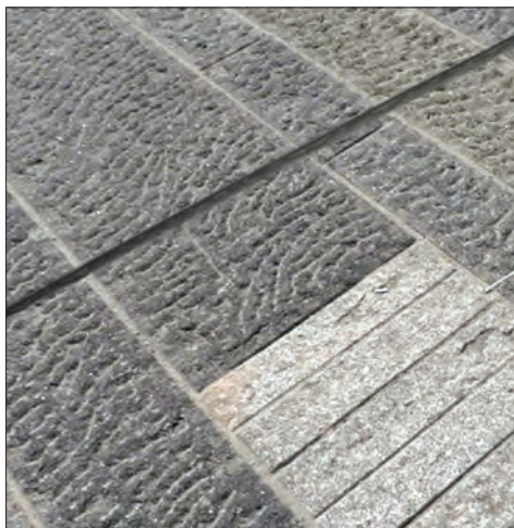
Ekspansjonsfuge. Korrekt lagt i rett linje gjennom belegget.

Det betyr at en fuge på 10mm kun kan ta 1 mm ekspansjon/kontraksjon!