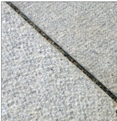
Korning i ekspansjonsfugen.